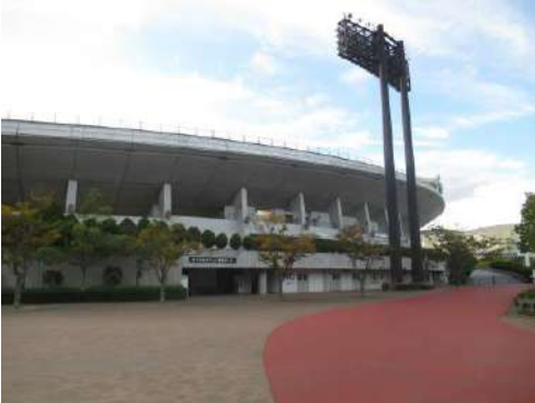
■ほっともっとフィールド神戸